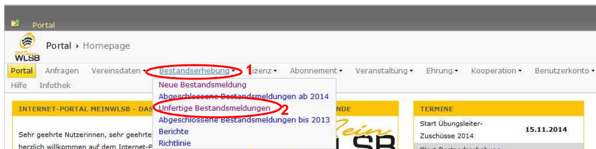
Abbildung 4: Aufrufen einer gespeicherten und noch nicht versandten Bestandsmeldung

Sie sehen anschließend eine Übersicht, in der die gespeicherte Bestandsmeldung zu sehen ist. Sie hat den Status „Bearbeitung“. Um diese gespeicherte Bestandsmeldung zu öffnen und weiterzubearbeiten, klicken Sie links in der Zeile auf „Details“.